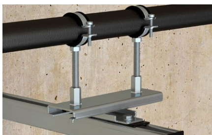
Linee di distribuzione con dilatazione termica.